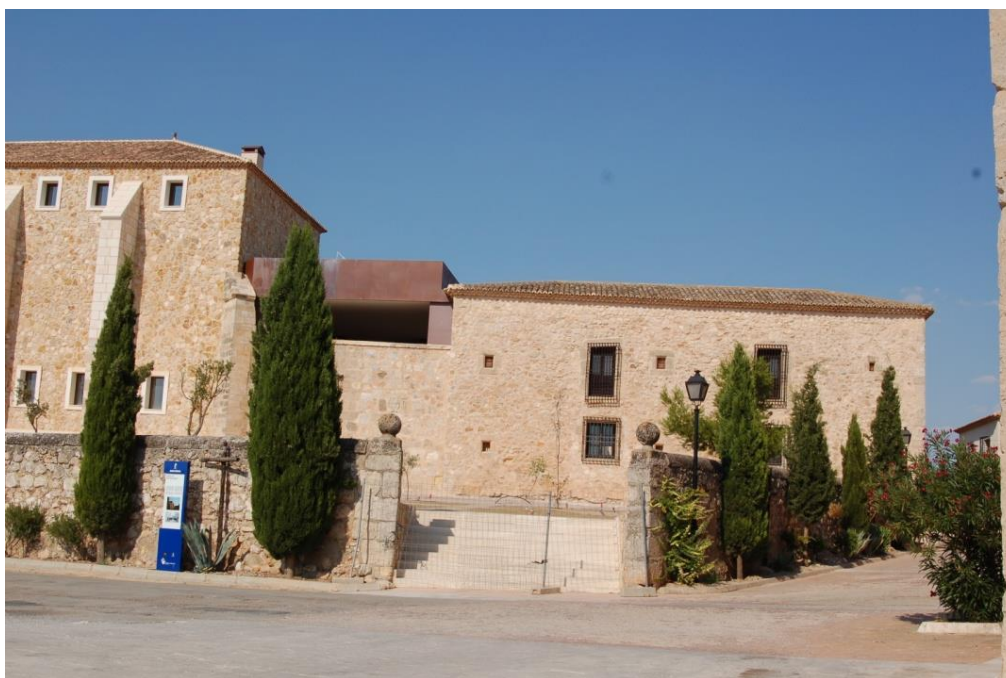
Maestre de la Orden de Santiago, y don Pedro Girón, Maestre de la Orden de Calatrava.

El Palacio de don Juan Manuel es el edificio señorial más antiguo de la Villa. La fachada exterior consta de un enorme lienzo de piedra con varios contrafuertes de sillería, con escasos ventanales sencillos y dos puertas de estilo plateresco. Del edificio partían dos antiguas murallas de piedra de yeso que circundaban el pueblo, construidas por el propio don Juan Manuel en 1323.