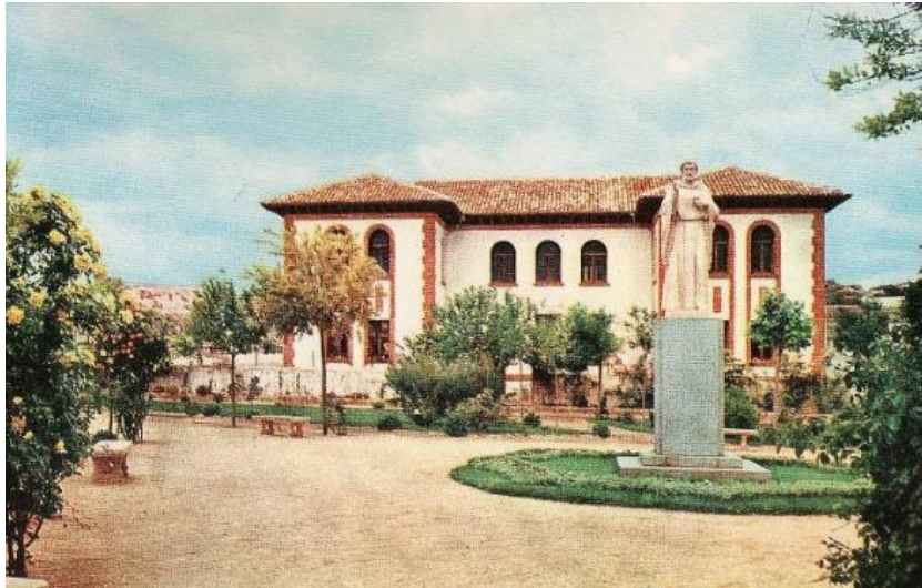
Colegio de 1ª y 2ª enseñanza

Durante los días 4 y 5 de octubre de 1918 se celebró en Belmonte una asamblea provincial de médicos, realizada por el colegio de medicina de la provincia, siendo presidida por el doctor Cortezo. En dicha asamblea se trataron, entre otros asuntos, las posibles propuestas que se habían de llevar al Congreso Nacional de medicina de Madrid.