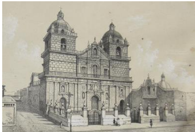
Colegio Jesuita de Lima (Perú)

Ingresó en Granada en La Compañía de Jesús en 1596. Se embarcó para América, después de haber concluido sus estudios.