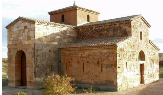
Templo Visigodo de S. Pedro de la Nave (Zamora)

En la tierra de Belmonte, durante esta época se desarrolló el cultivo del cereal y las explotaciones agropecuarias. Necesitada de agua, se practicaba el sistema de secano o se recurría a los molinos y afines, sistema que fue heredado de los romanos. En la vida rural predominaban los latifundios, cuyos dueños eran grandes señores, que contaban con cierta autonomía. En los más importantes se construyeron las llamadas iglesias “ Propias ”, en las que el propio señor sin autorización episcopal nombraba al clérigo de la misma.