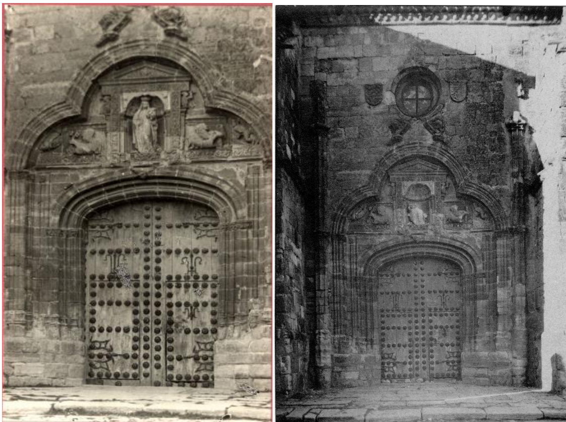
La primera fotografía corresponde al año 1917. La segunda al año 1939 (se puede observar que la imagen de la hornacina ha sido destruida)

Se salvó gracias a la acción de las autoridades locales y de los vecinos, que se opusieron e impidieron en lo posible que fuera arrasada, aunque no así su órgano, resultando decisiva la intervención de la Junta Provincial y la Junta Central que visitó Belmonte en septiembre de 1938. A pesar de ello, se requisaron las joyas, alhajas, así como todo el oro y la plata.