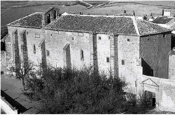
Monasterio de dominicas de Belmonte. Fotografía años cincuenta del siglo pasado. Archivo fotográfico Nicolás Medina

echamos de menos la espina de la corona de Cristo, que las monjas dicen guardar en las Relaciones Topográficas de 1575 3 .