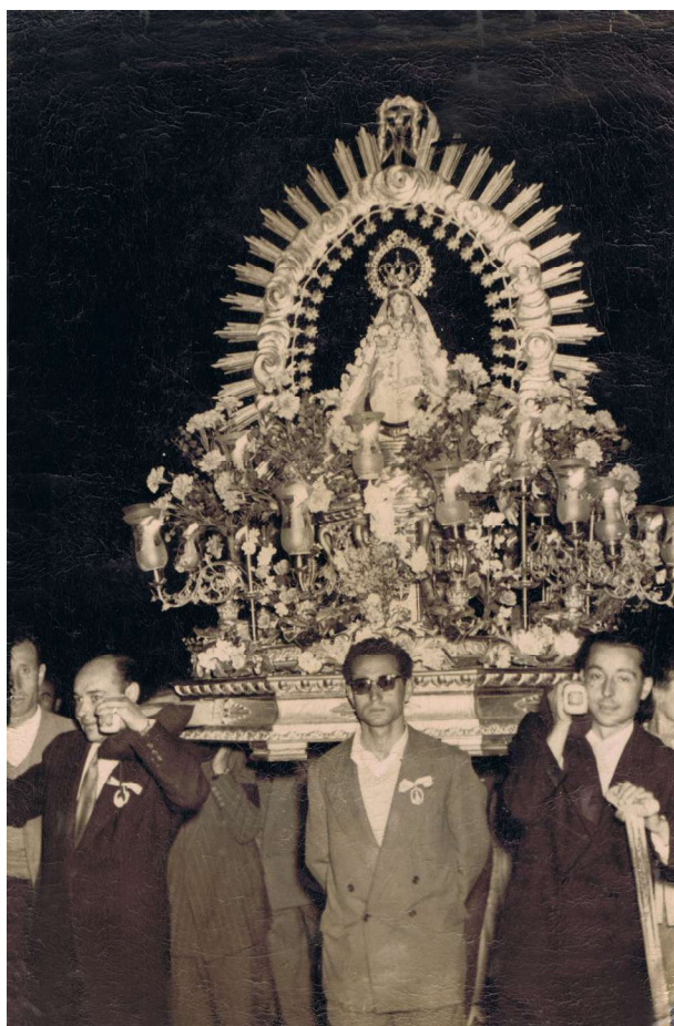
Coronación de la Virgen de las Angustias.