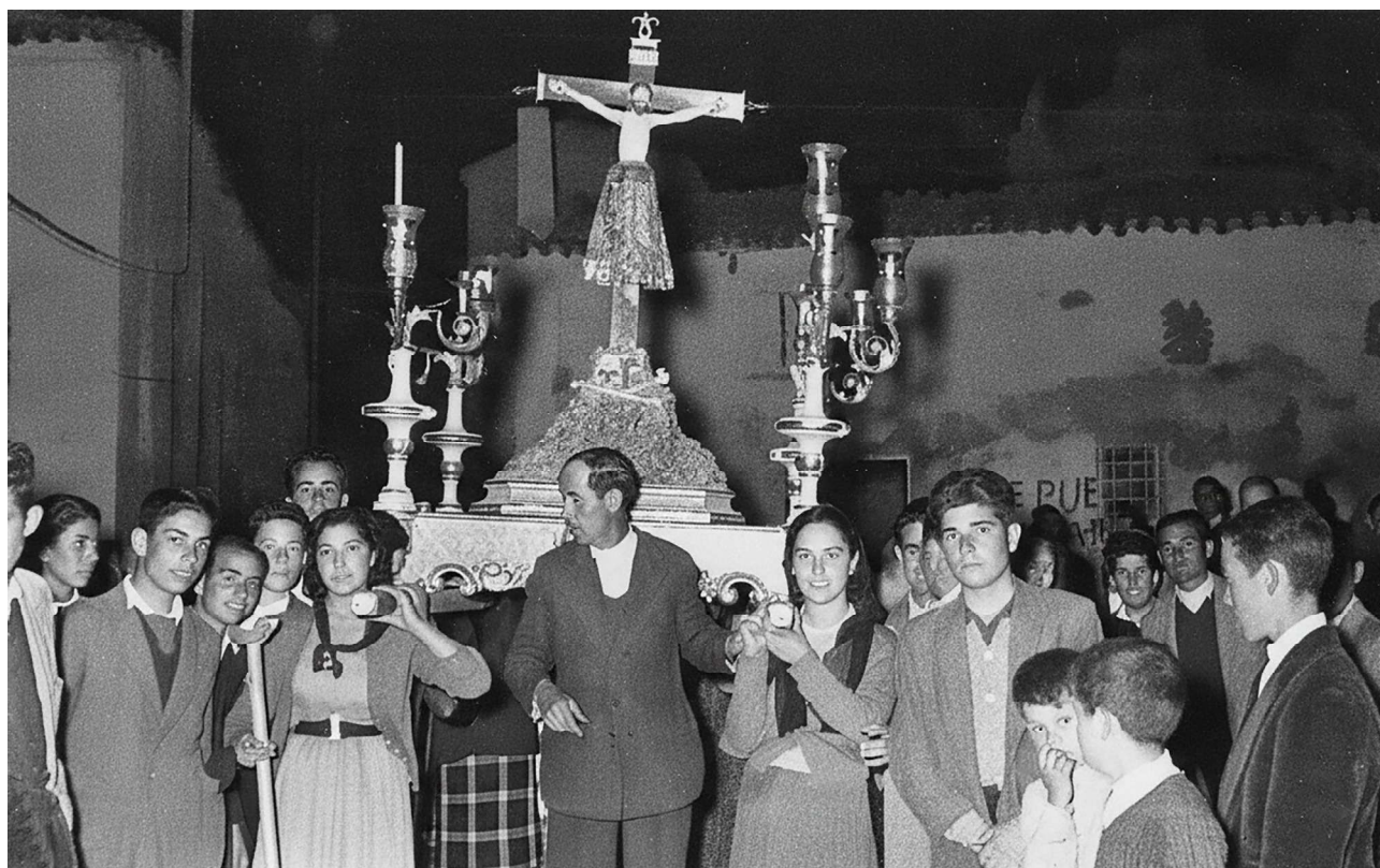
Procesión del Cristo de los Peligros el día de su festividad. Años cincuenta del siglo xx