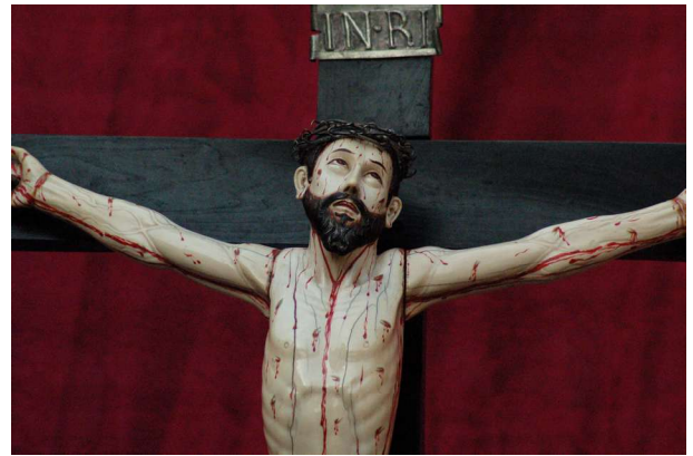
Detalle de la imagen del Cristo de los Peligros

y Sagrado Lignum Cruzis, que en ella, en su Capilla, se veneran 8 . Documentos que le fueran remitidos al Sr. Administrador del Hospital de San Andrés de Belmonte.