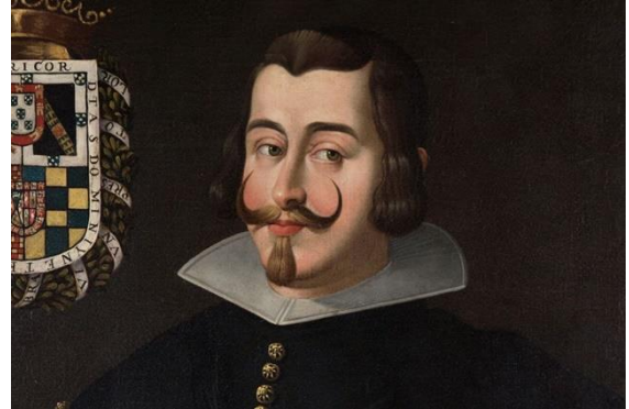
Retrato de Diego Roque López Pacheco. Tomado de la Real Academia de la Historia.

El duque de Escalona viajó a México acompañado también por el recién nombrado obispo de Puebla, Juan de Palafox y Mendoza, quien iba como visitador general del reino y llevaba el encargo de realizar el juicio de residencia de los dos anteriores virreyes, Rodrigo Pacheco, III marqués de Cerralvo y Lope Díez de Armendáriz, marqués de Cadereyta. López Pacheco se retrasó algunos meses en el puerto por las fiestas que celebraban su llegada, haciendo su entrada solemne a la Ciudad de México el 28 de agosto. Pronto se hizo popular, a pesar de la introducción de timbres fiscales y el envío de más tributos a España 5 .