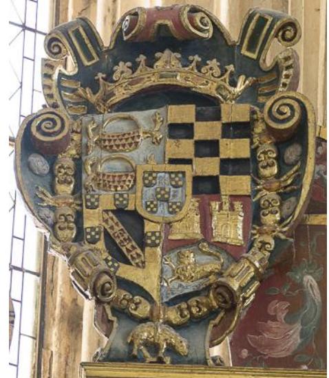
Heráldica de Diego Roque López Pacheco. Retablo Mayor Colegiata de San Bartolomé De Belmonte.

Don Diego Roque López Pacheco, VII marqués de Villena y duque de Escalona, fallece en la ciudad de Pamplona el día 23 de febrero de 1653, siendo sepultado en el Monasterio del Parral en Segovia, en el panteón familiar que mandara construir su ascendiente directo (sexta generación), también belmonteño, don Juan Pacheco, I marqués de Villena y I duque de Escalona.